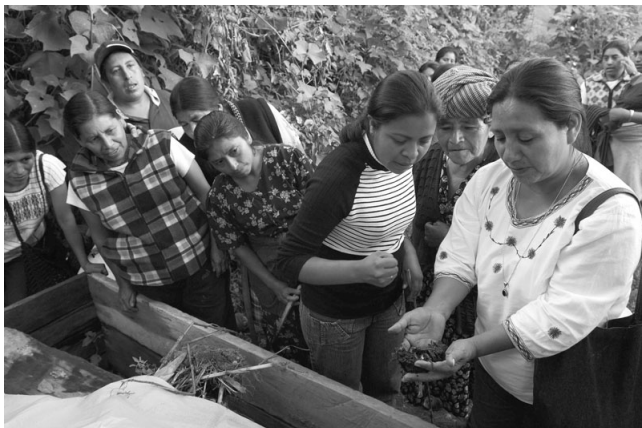
Bauernfamilien der Mixe-Indianer setzen auf ökologischen Landbau