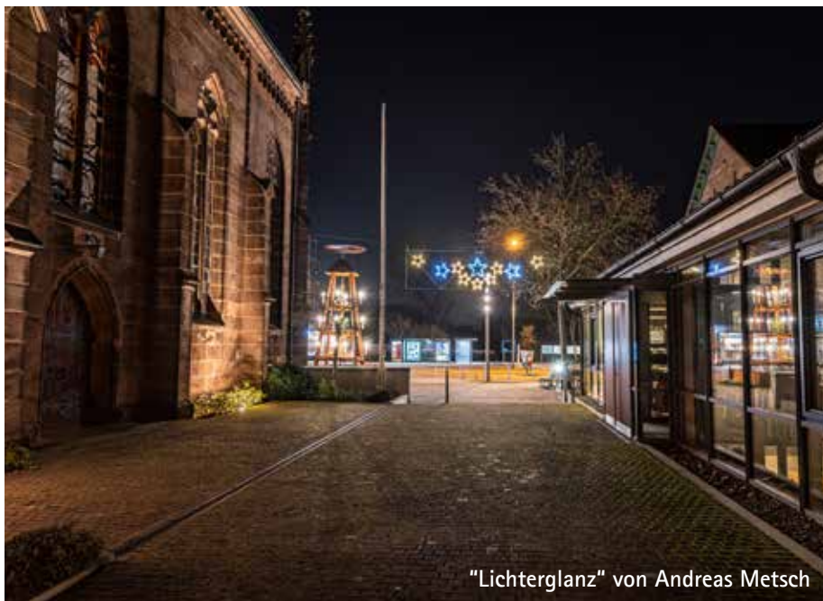
"Lichterglanz" von Andreas Metsch

Unsere Kirchen stehen allen Menschen unabhängig von Gottesdiensten und Andachten für das persönliche Gebet offen. Schauen Sie sich gerne in den Kirchen um. In der Martin-Luther-Kirche liegen kleine Hoffnungs-Tüten zum Mitnehmen aus.