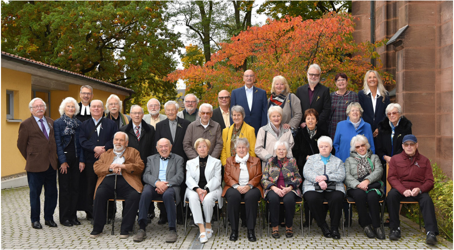
Birgit Neumüller/Viva Photography Stein